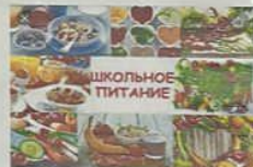
ГРАФИК ПИТАНИЯ ОБЕДЫ